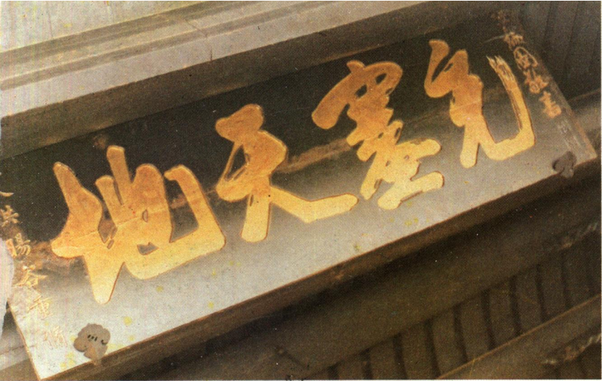
通淮廟《充塞天地》匾，明代張瑞圖所書。