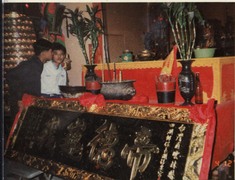
本廟贈送雲林縣保長湖保安宮 匾額、香爐——圖為保安宮殿內。