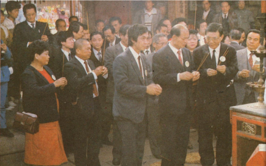
台灣道教親善訪問團來廟訪問。