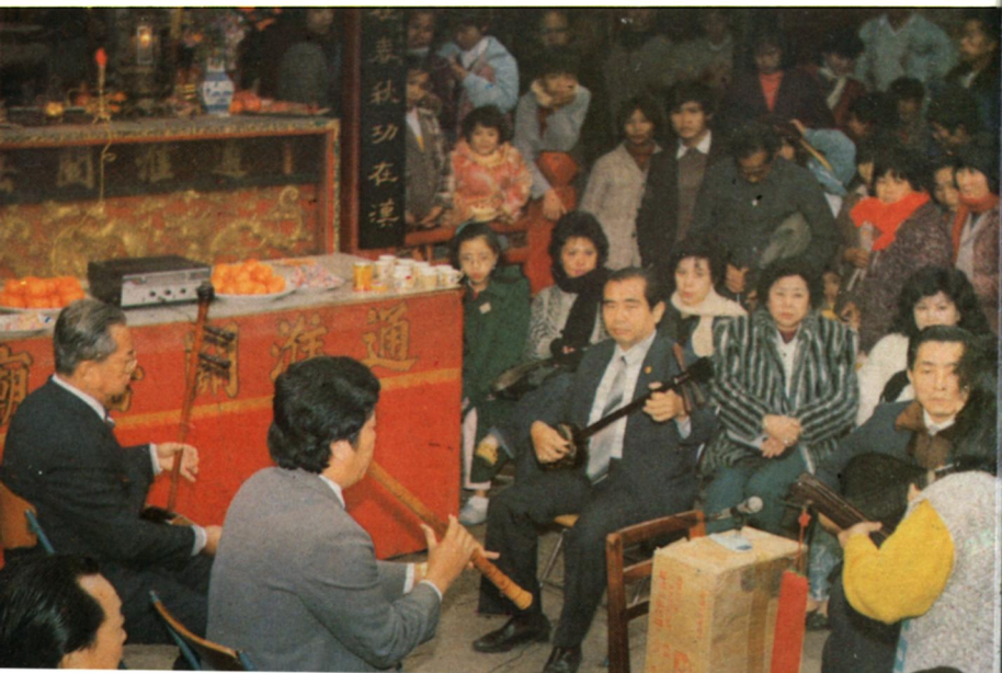
海外僑胞來廟獻演南音。