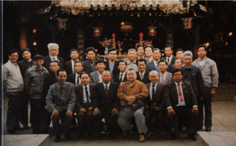
灣雲林縣保長湖保安宮一九九〇年四月 臨祖廟進香時與本廟董事會合影留念。